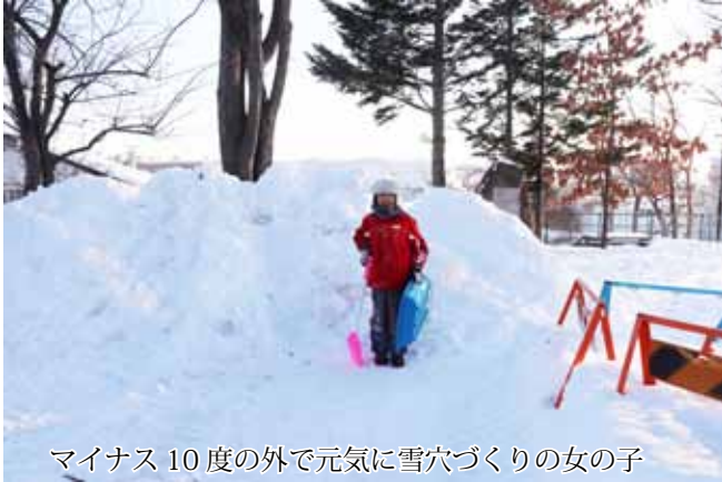
マイナス 10 度の外で元気に雪穴づくりの女の子

冬季間は、館内への訪問客ばかりではなく、かつてのピアソン邸の広い庭に遊びに来るお客さんがいます。当然子供たちがほとんどです。市内の保育所の園児が先生に連れられてのソリ滑りなど。寒い冬を元気に楽しんでいます。近所の子供も除雪した雪山に秘密基地を作り毎日せせと雪穴を掘っています。昔と同じ光景です。