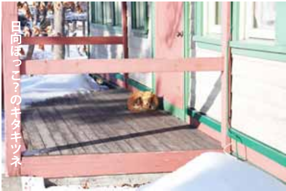
「向ぼっこ」のキタキツネ