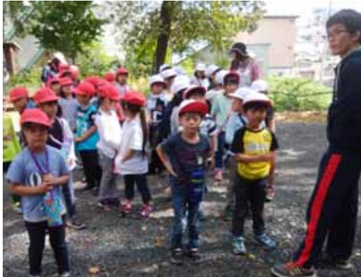
写真左／北見市立中央小学校一年生40名の来館。(9月22日)