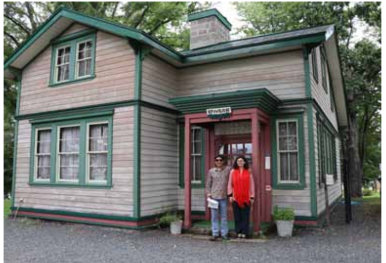
写真下／帯広市の老人クラブ連合会の皆様が、北見での全道大会の帰りに当記念館へ寄ってくださいました。ピアソン夫妻の十勝監獄伝道に興味津々。(9月29日)