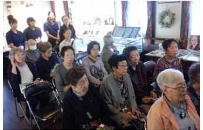
写真上／北見勤医協利用者の団体18名の来館。北見の歴史解説に耳を傾けていました。(8月23日)