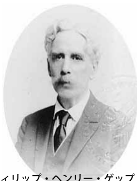
フィリップ・ヘンリー・ゲップ