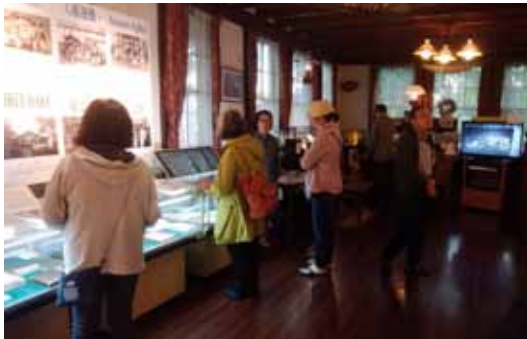
写真左／「北見文化財めぐり」の来館者。(9月22日)