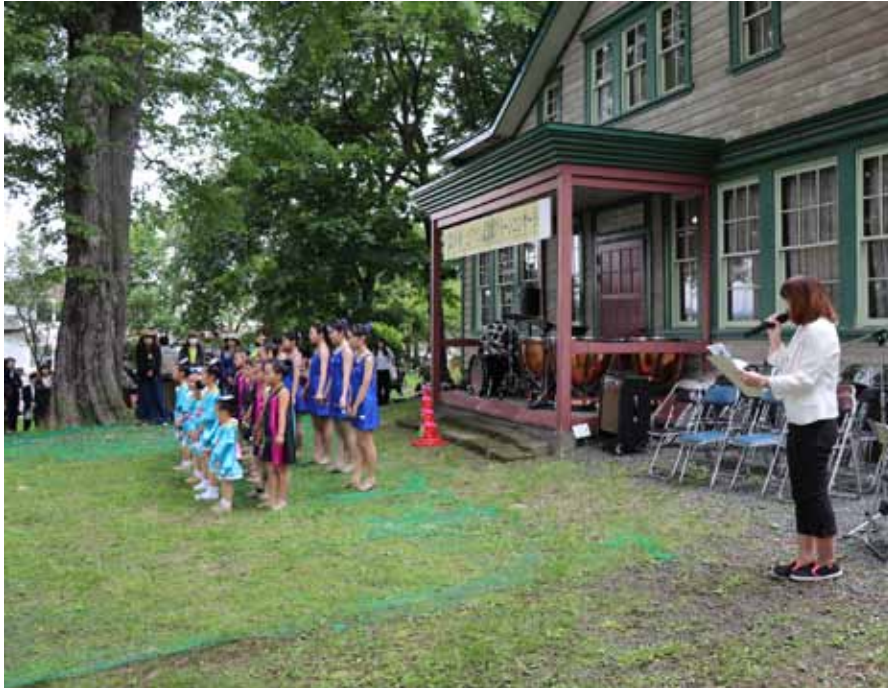
写真上：20年目となるグリーンコンサートの開催。オープニングは、アイランドバトンクラブ/チームエンジェル。昨年に続いての出演です。少々肌寒さが気になる天気でした。

去年は、参加5団体のうち3団体までの演奏が終了したところで暴風雨警報が発令され、4番目の北見工大&日本赤十字北海道看護大の吹奏楽部以降2団体の演奏が中止となりました。本年はそのリベンジよろしく、敢えて昨年と同じ5団体の演奏会として企画してみました。 天候は決して恵まれたものではありませんでしたが、5団体の演奏終了まで雨の心配もなく、最終演奏まで実施することができました。しかし、ここ数年この時期の天候が、極めて不安定な天候になりつつあるかな、との実感がしています。開催時期の変更も必要かもしれません。