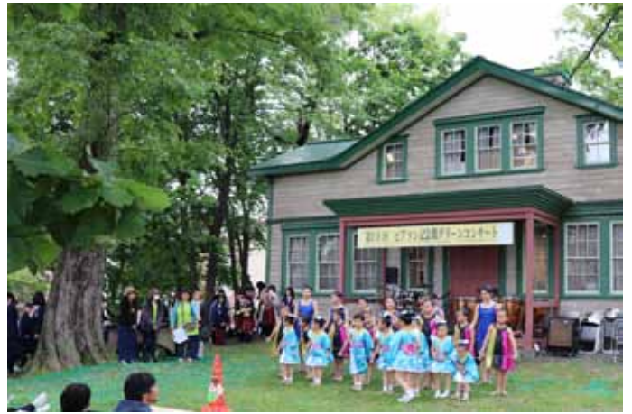
写真上：チームエンジェル全員でのご挨拶。 写真下：北見工大&日本赤十字北海道看護大学吹奏楽部の皆さん。

コンサート1番目の登場は、昨年初めて出演したアイランドバトンクラブのチームエンジェルの皆さん。小学校低学年の女の子11名による「はっぴい夏祭り」、小学校高学年の女の子7名での「キラキラ」の演技、最後は中学生女子7名で「プロブレム」のバトン演技。空高く投げ上げたバトンを上手に受け止め踊る演技に、会場からは惜しみない拍手が沸き起こっていました。