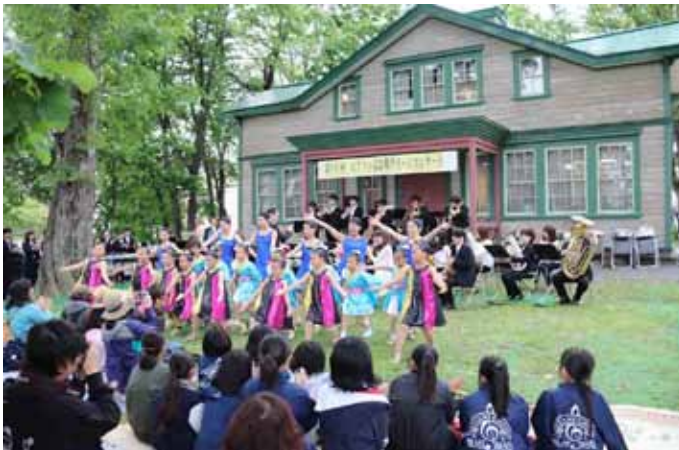
写真下：北見吹奏楽団のみなさん。