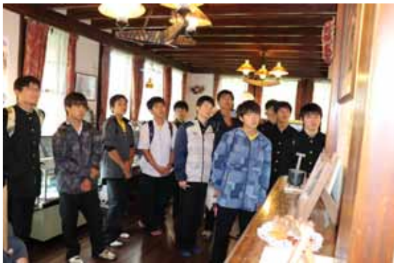
写真右／自分たちが通う学校が、ピアソン記念館とゆかりがあることに驚き、展示物に見入る生徒達。