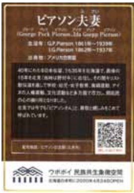
写真右／表面。 写真下／裏面。