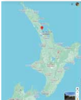
【写真右】ハード顧問の住む、ニュージーランド北島。

冬の北海道から帰られたハー ド顧問の住むニュージールランド 北島のファンガパラオアは、首 都オークランドから約50 kmに位 置する所です。